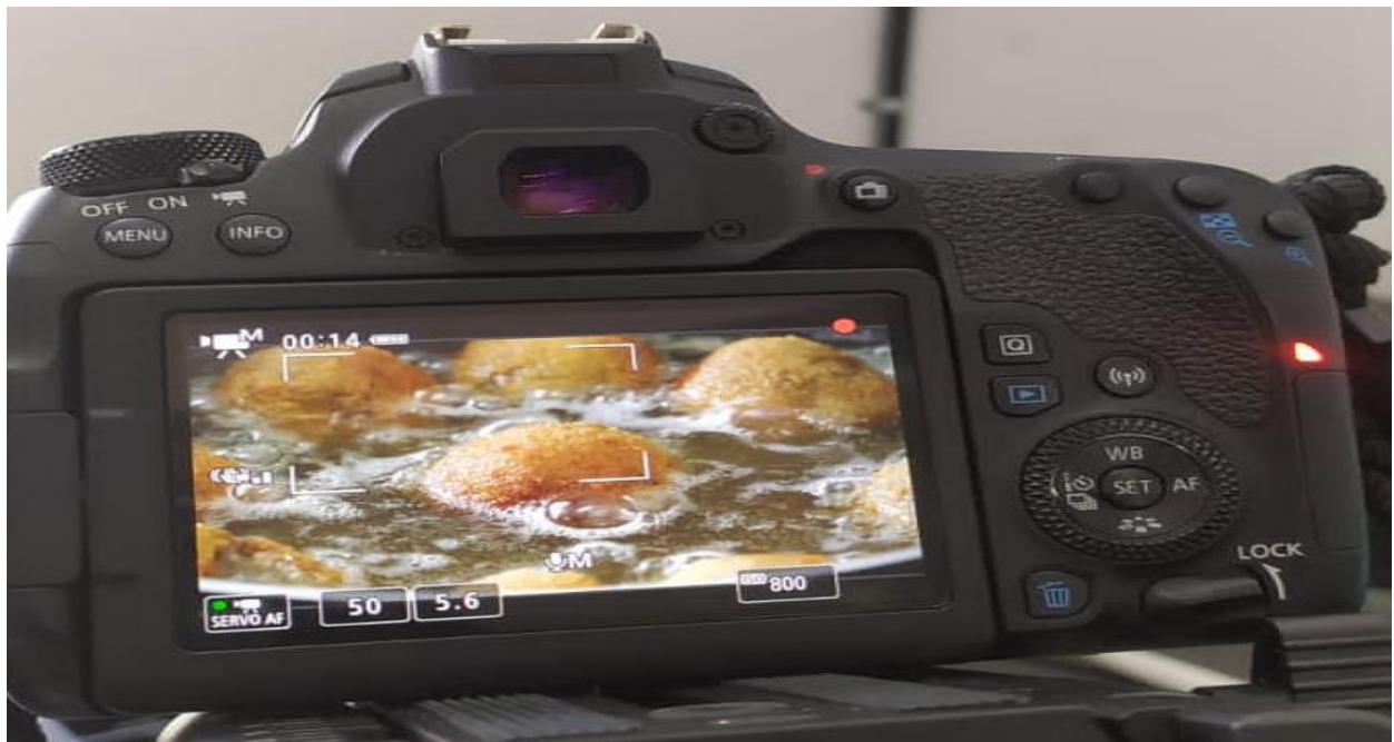
(ii) Stills of fish ball preparation