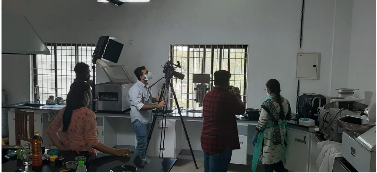
VIDEO SHOOTING STILLS (i)