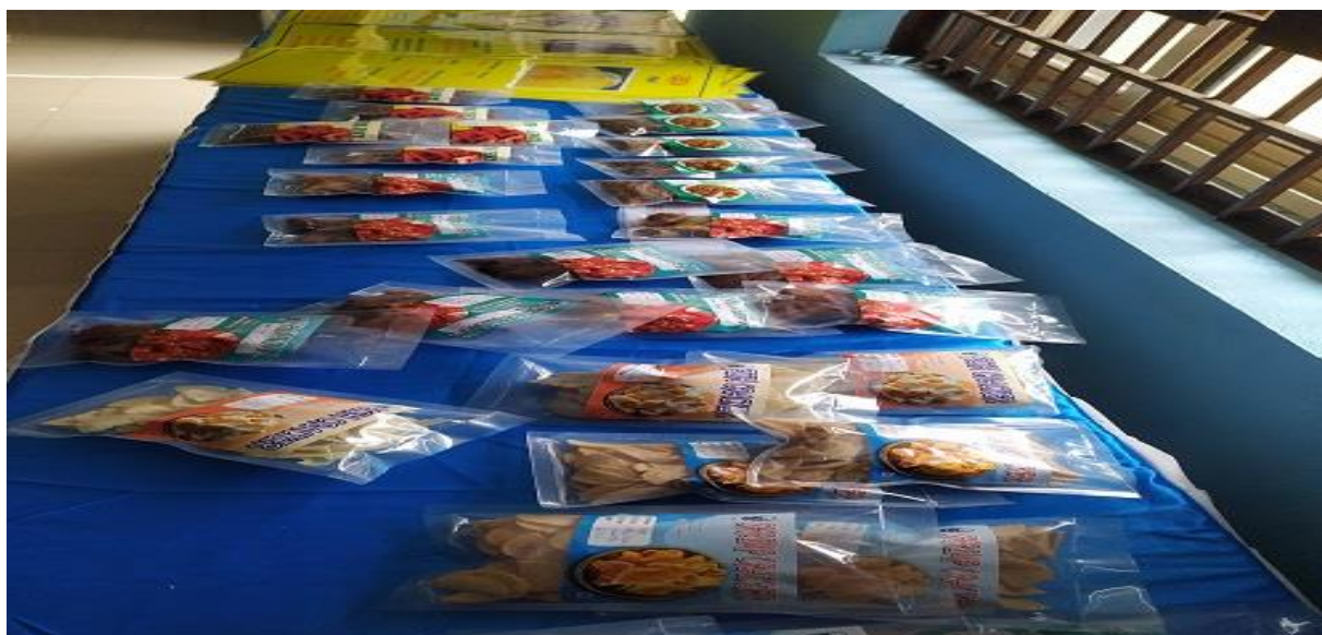
Products kept for sale during ICAR Agriculture Day