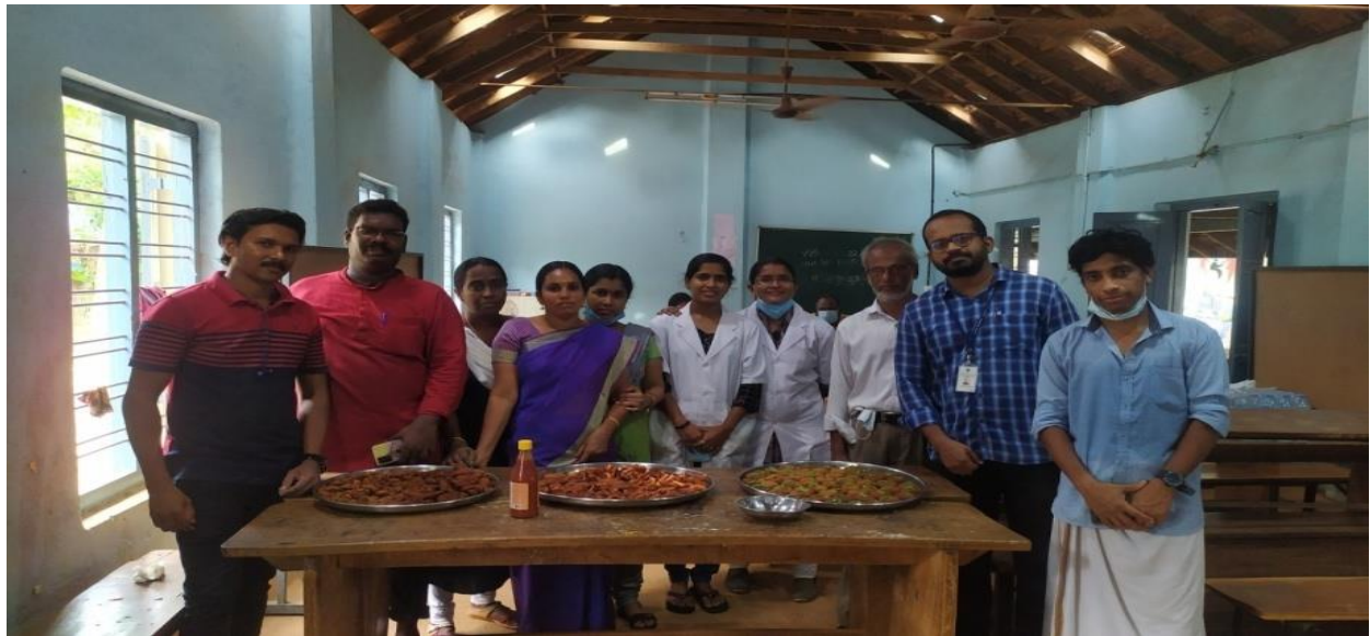
Products prepared during the two day training programme