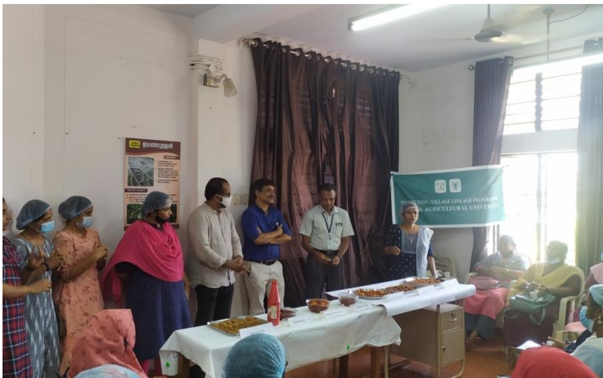
FINAL SESSION (display of products prepared by the participants)